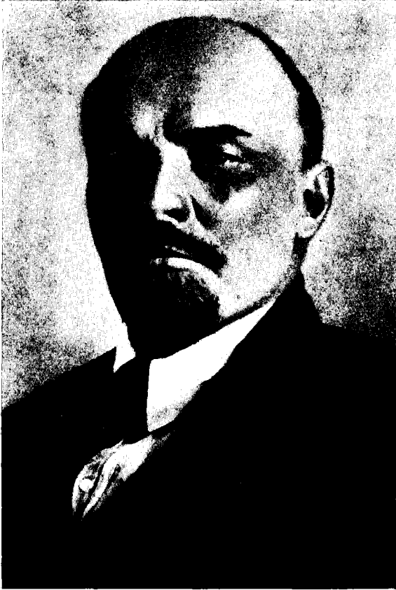
W. I. LENIN