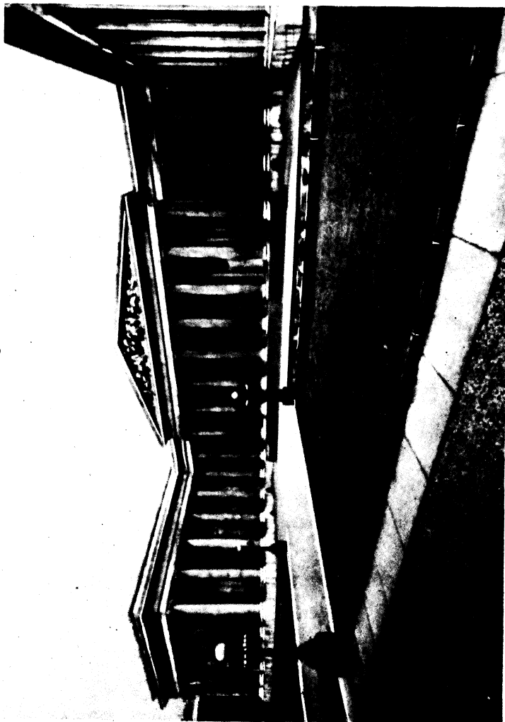
Das Britische Museum in London