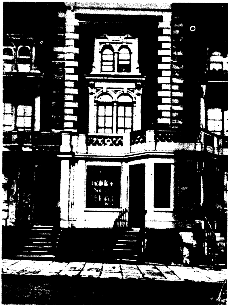
Haus in London (9, Grafton Terrace, Maitland Park, Haverstock Hill), in dem Marx von Oktober 1856 bis 1864 wohnte